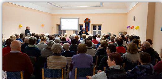
Izobraževanje članov Karitas v Elizabetinem domu za celotno Koroško regijo.